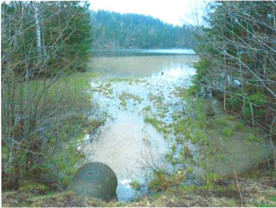
Stor partikkelmengde som har sin opprinnelse i Leirdalen føres ut i Damtjern. Vannkvaliteten i flere av bekkene overvåkes kontinuerlig