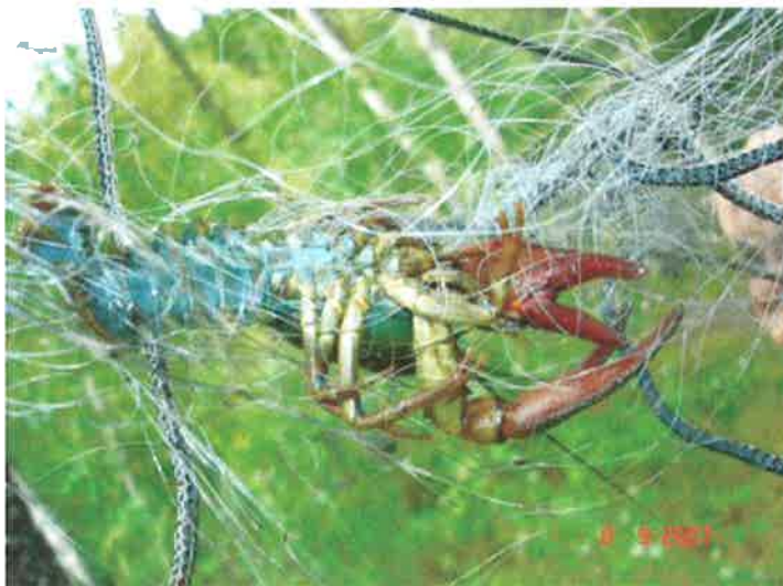
Ferskvannskreps har et spesielt vern i Norge, siden den er relativt sjelden

Som vist tidligere, har Damtjern et generelt høyt biologisk mangfold. Dette må også tas hensyn til ved en framtidig detaljert undersøkelse av innsjøen. Selv om innsjøen har en rekke fiskearter som kunne fjerne byttearter, finnes fortsatt ferskvannskreps i denne innsjøen.