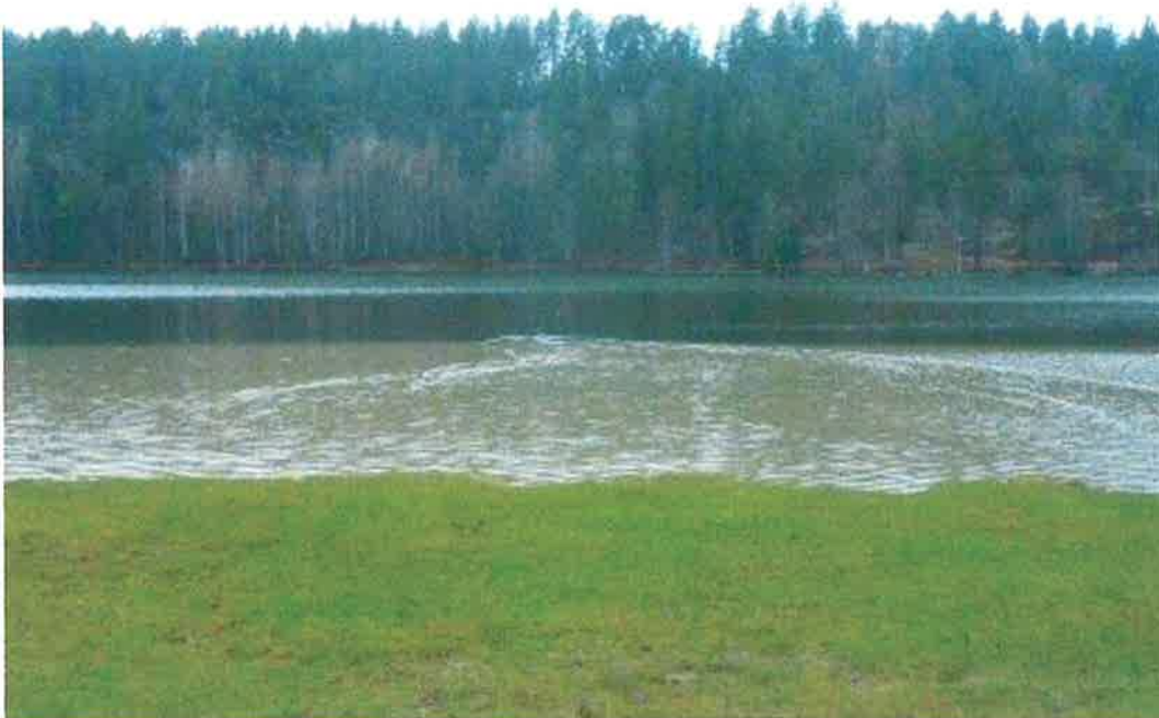
Disse partiklene blandes inn i vannmassene og gir en betydelig påvirkning her, med bl.a. sterkt nedsatt siktedyp, som nesten kan sammenlignes med forholdene i bresjøer med direkte kontakt med brevann