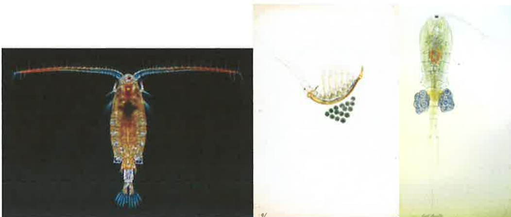
Artene over Acanthodiaptomus denticornis (venstre), gelekrepssene Holopedium gibberum (midten) og Cyclops scutifer (høyre) er karakteristisk for mer næringsfattige (og ofte humøse) innsjøer, og blir betydelig sjeldnere eller faller ut når innsjøene overgjødsles (= eutrofieres).

Vi har det siste tiåret undersøkt de fleste innsjøer i Kjekstadmarka og i nærmeste omgivelser. Derfor kan vi konkludere at Damtjern opprinnelig var en oligotrof lokalitet med et tydelig humøst (= myrvannspreg) og fortsatt finnes mange av artene fra denne epoken (se figurene). Innsjøen er nå i ferd med å eutrofieres, med tydelige tegn innen planteplankton og dyreplankton. I tillegg er det blitt altfor mye fisk i lokaliteten, som medfører et meget høyt predasjonstrykk.