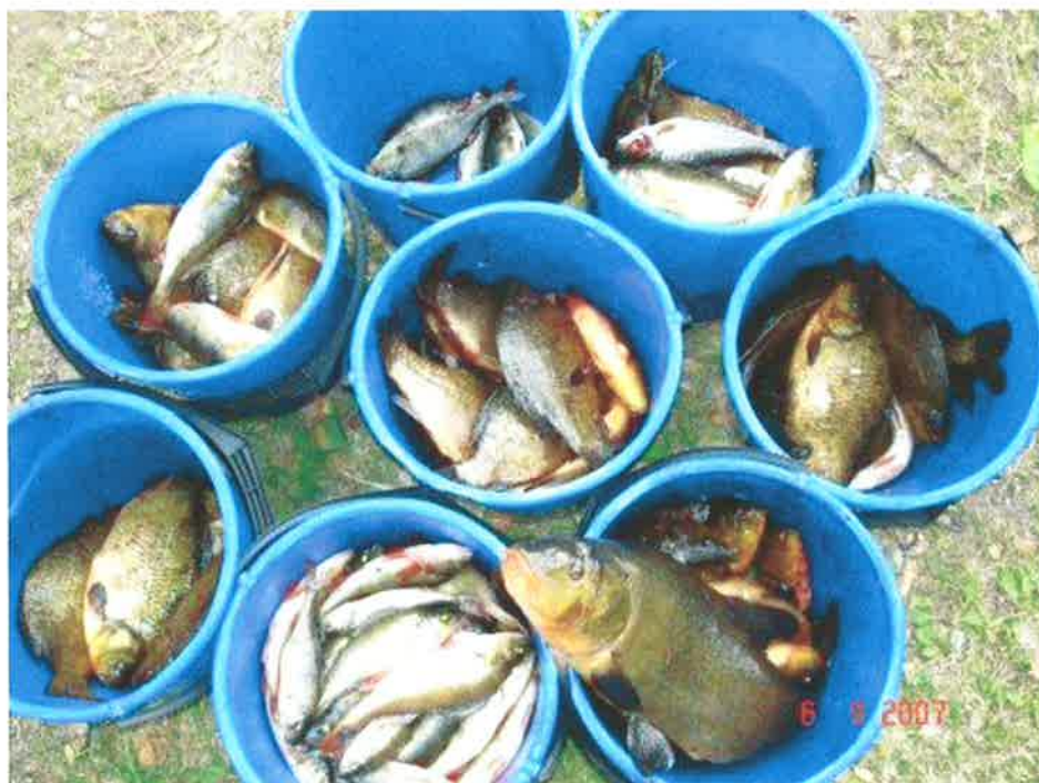
Damtjern – fra prøvefisken i september 2007

Utbredelsen av lite ettertraktede konsumfisk i Norge som sørv, suter, gjedde og regnlaue har de siste tiår fått en iøynefallende kraftig økning i en rekke innsjøer langs kysten av Sør-Norge, og mange tidligere gode fiskevann har blitt kraftig negativt påvirket og områder som tidligere var attraktive fiskeutfartssteder blir berørt. Verdien av arealene synker derfor betydelig både i attraksjonsverdi og økonomi for grunneiere, reiselivsnæring, kommuner som friluftsområder og de fleste typer sportsfiskere, bortsett fra gjedde- og karpefiskere. Denne spredningen går raskt og store deler av de kystnære innsjøene i Sør-Norge er nå i faresonen.