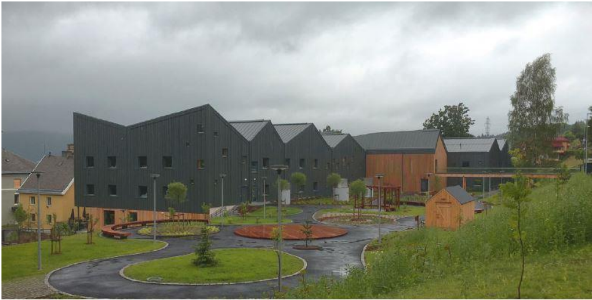
Sansehagen – som blir liggende mellom Byggetrinn 1 og Byggetrinn 2

Til første byggetrinn av Fosshagen ble det gjennomført 5 kunstprosjekter; ett i foaje/inngangsparti, et ute og 3 i dagligstuene på avdelingene. Erfaringer og tilbakemeldinger fra dette tilsier at kunstprosjektene i dagligstuene ikke fungerte etter sin hensikt, da kunsten stilte for høye krav til at bruken av dagligstuene skulle tilpasses kunsten. Dagligstuene er beboernes hjem og må tilpasses på hver enkelt avdeling i forhold til beboeres og ansattes bruk. Intensjonen var å gi beboerne kunst der de oppholder seg mest, slik at de skulle få god bruk av den, men i praksis kom kunsten i veien for den praktiske anvendelsen av stuene. Dagligstuene er beboerne sitt hjem og er ikke åpent for andre enn pårørende som kommer på besøk. Dagligstuer i avdelingene vurderes i dette prosjektet ikke som offentlig rom og disse er ikke aktuelle som sted for kunst.