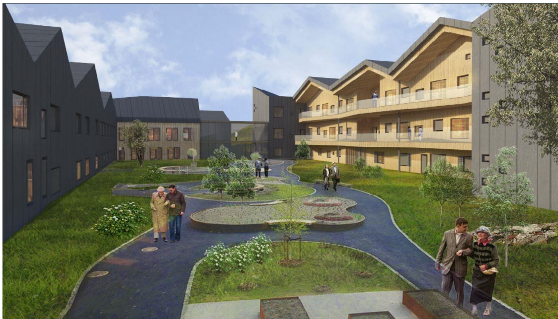
Fosshagen del 2, sett fra eksisterende sansehagen