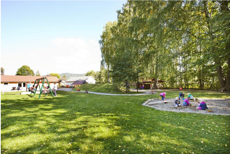
Figur 15: Linnestranda barnehage

Ved å utvide Sprellopp Linnestakken og Linnestranda barnehage vil behovet for barnehageplasser øst i Fjordbyen mest sannsynlig være dekket inntil utbyggingen på Gullaug er i gang.