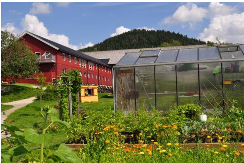
Figur 1: Lier Natur og landbruksbarnehage SA er lokalisert i driftsbygningen på Foss gård

Både skoler og barnehager bør lokaliseres inntil eller nær idrettsanlegg og –haller, og andre utearealer slik at arealene kan sambrukes.