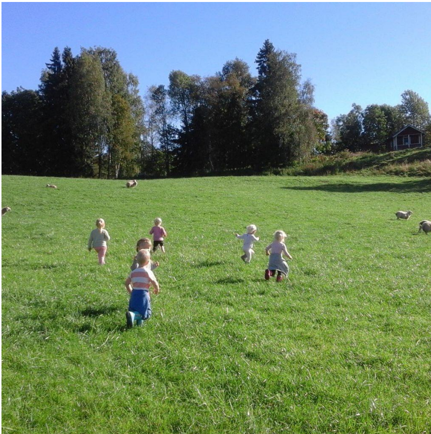
Glade barn i enga på Nedre Stabæk barnehage