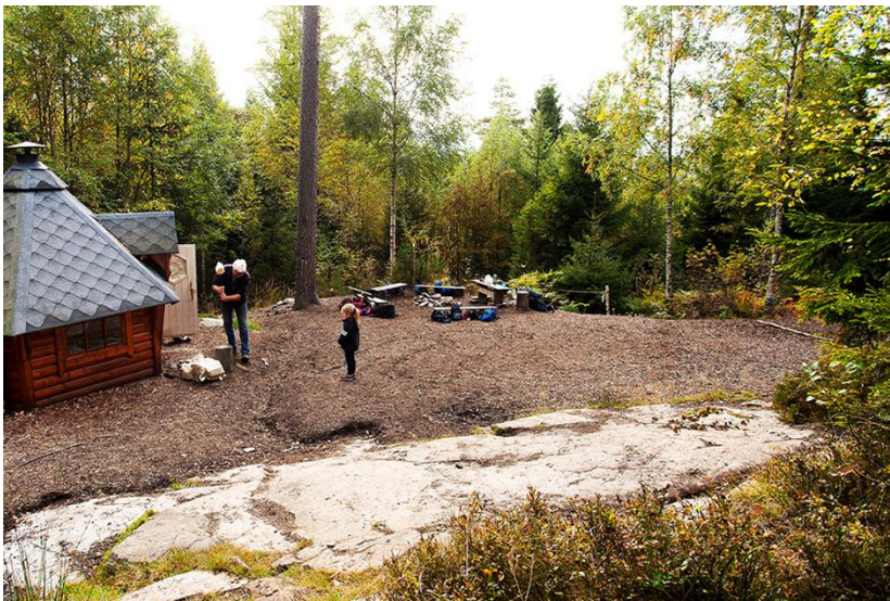
Figur 8 Dambråtan barnehage – vedhogging:

Barnehagene i Sylling krets har mye større tomteareal enn de må ha.