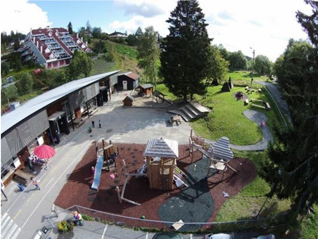
Figur 14: Akebakken barnehage