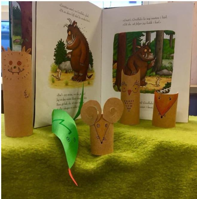
Figur 10: Espira Eikenga barnehage - utstilling

Antall barn i alderen 1-5 år i kretsen vil vokse fra ca. 400 i dag til ca. 600 i 2034. Nesten hele veksten kan knyttes til utbygging av Lier hageby, Utsikten/Bråtan og i Lierbyen sentrum, der det ser ut til at barnetallet øker med ca. 200 barn frem til 2034. I Egge vil barnetallet ligge stabilt på ca. 70-80 barn i alderen 1-5 år.