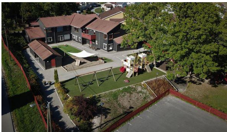
Figur 4: Nøste barnehage

Mye av boligbyggingen i kretsen skjer på Engersand. Det bygges eneboliger og man må regne med at barnefamilier vil flytte dit. De nærmeste barnehagene som har ledig plass er på Nøste og i Hasselbakken, og det vil nok oppfattes som upraktisk.