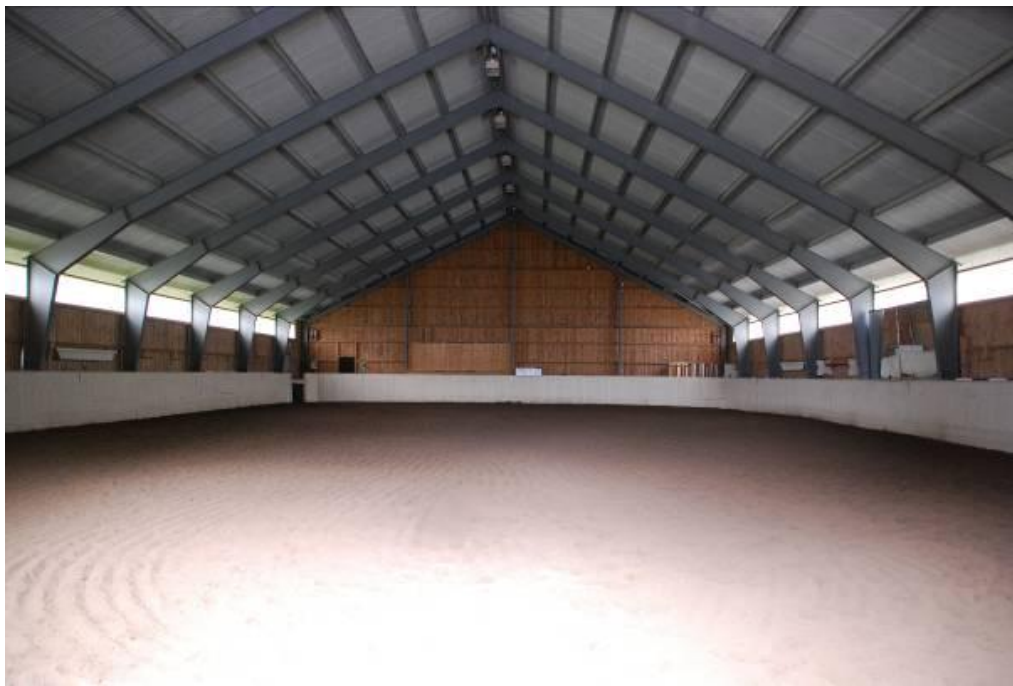
Figur 4 Ridehallen hos Stall Storemark