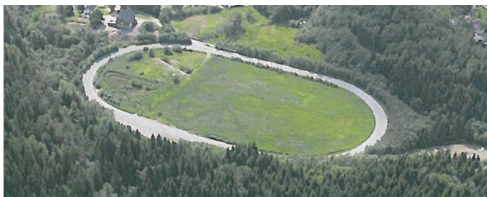
Figur 3 Travbanen på Kraft, Tranby

Dette er flere travbaner, rettstrekker, galoppspor og treningsfasiliteter for travhest og galopphest i drammensregionen: