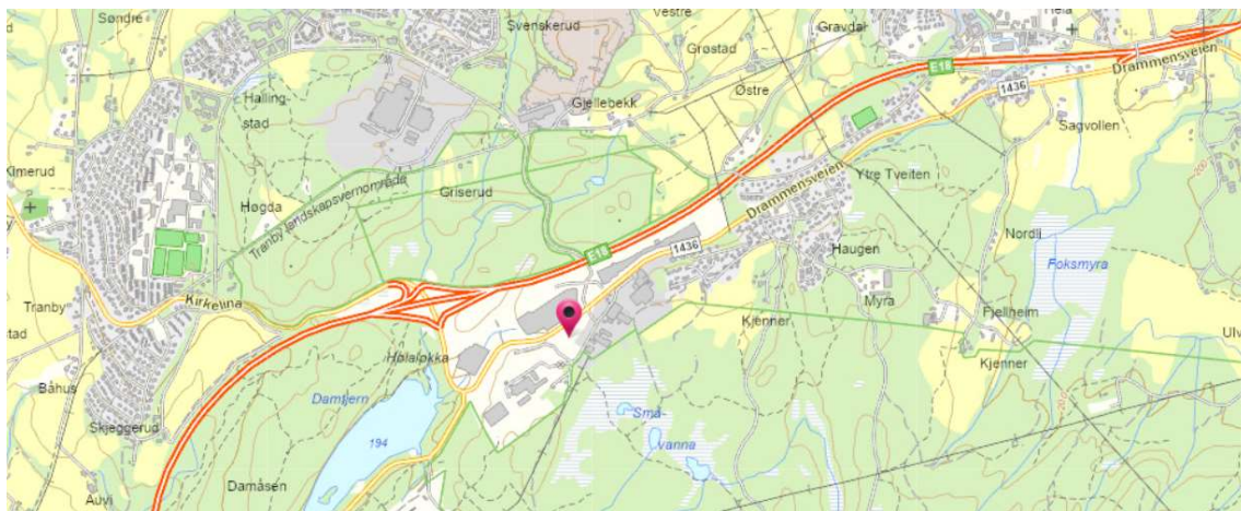
Figur 1. Lokalisering, planområdet vist med rød pinne.