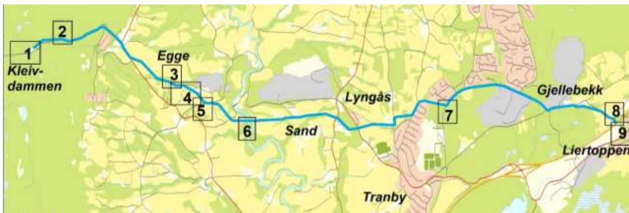
Figur 1: Kart som viser planlagt trasé for ny hovedvannledning (blå linje) og nummererte områder der planområdet utvides (1-9)

I vest er planområdet utvidet ved Kleivdammen (1). Kleivdammen skal gjenfylles og det eksisterende vannbehandlingsanlegget skal rives og erstattes av et nytt og større anlegg. I et forstudie for dette nye vannbehandlingsanlegget er det avdekket et behov for større areal enn det som er regulert i gjeldende reguleringsplan for Eiksetra med løype trasé og adkomstvei (PlanID 504-903-10-02). Dette medfører at Eikseterveien forbi vannbehandlingsanlegget må flyttes mot sør. Utvidelsen av planområdet her har et samlet areal på ca. 11 daa.