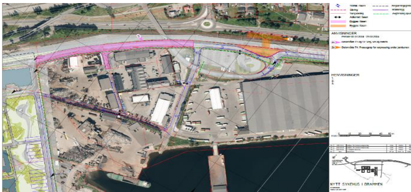
Fase 2 jan 24 – april 24