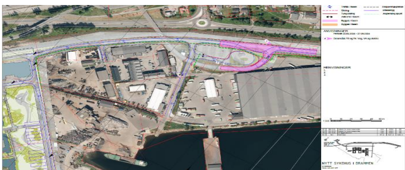
Fase 4 juni 24 – september 24