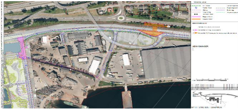
Fase 1 juli 23 – jan 24